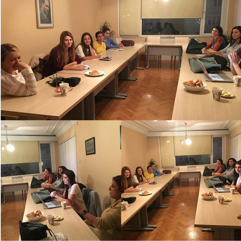
TPD Kadın ve Toplumsal Cinsiyet Çalışmaları Birimi yeni dönem hazırlık toplantısından.